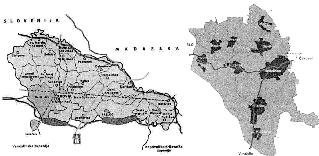
Slika 1: Položaj Općine Nedelišće u Međimurskoj županiji i položaj naselja unutar Općine

Načelnik Općine Nedelišće, kao izvršno tijelo, sukladno zakonskoj obavezi, stavka 1. članka 20. Zakona o održivom gospodarenju otpadom (NN 94/13, 73/17, 14/19, 89/19), izrađuje Izvješće o provedbi Plana gospodarenja otpadom Općine Nedelišće za 2020. godinu. Navedenom odredbom Zakona propisano je da jedinica lokalne samouprave dostavlja godišnje izvješće o provedbi Plana gospodarenja otpadom jedinici područne (regionalne) samouprave do 31. ožujka tekuće godine za prethodnu kalendarsku godinu i objavljuje ga u svom službenom glasilu.